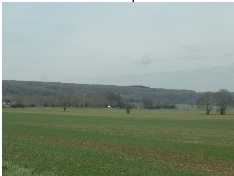
Le paysage champêtre autour du village