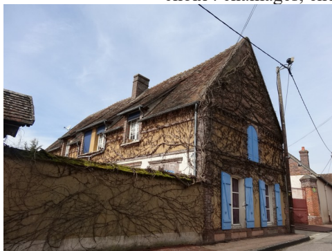
Une maison mêlant briques et moellons

Les avis seront cohérents avec ceux émis ces dernières années, à savoir : pas de maisons à volume compliqué (type V, W, Y, ou Z), pentes à 45° pour les volumes principaux, ardoise ou tuile plate de teinte brun vieilli, à 20u/m², avec un débord de toiture de 20cm, enduit de teinte beige clair avec modénatures (au choix : chaînages, encadrement de fenêtres, soubassement, colombage...). *Voir les autres fiches.