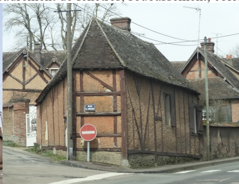
Des édifices à pans de bois