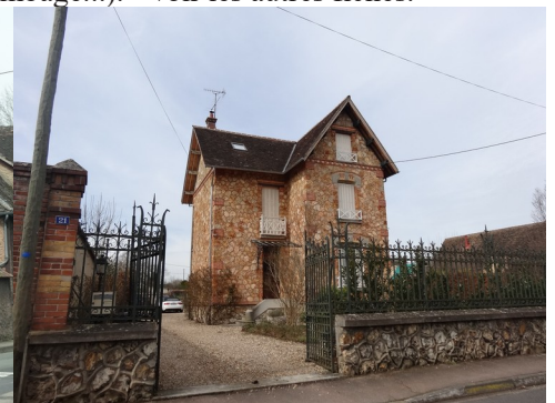
Une maison en meulière